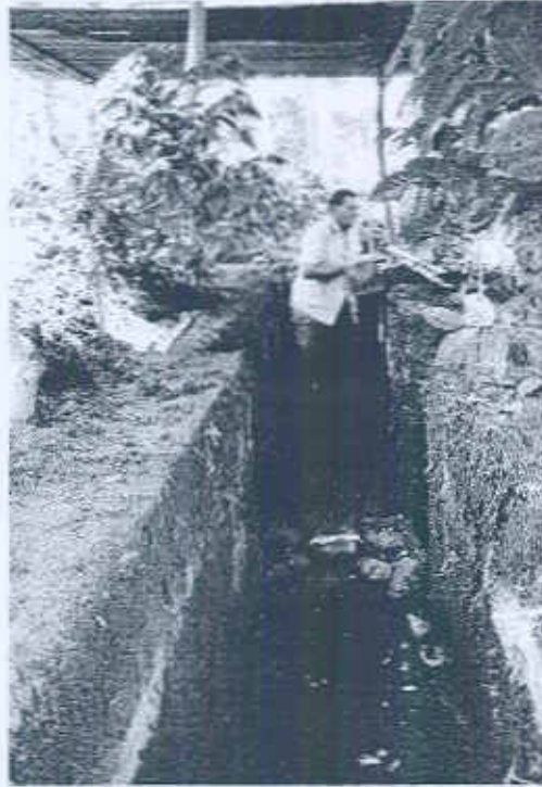
Foto 3: Galera construida en las extensiones este y oeste de la Operación CC-2 k (Flores 2013).