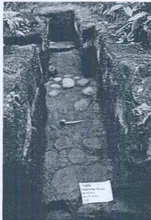
Foto 2: Extensiones este y oeste en Operación CC-2 k (Flores 2013).